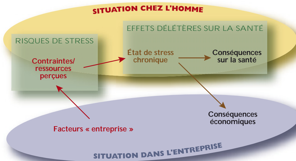
Fig. 1 : Définition schématisée du stress chronique.

Avant d'entrer dans la démarche de prévention, il est proposé, en premier lieu, un état sur les connaissances. Les aspects abordés correspondent aux différents thèmes de la figure 1 (hors facteurs « entreprise » abordés par J.F. Chanlat).